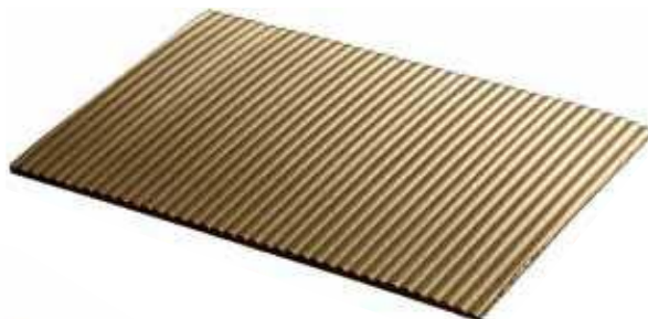
Plaque azurée (vendu en cm 2 sur mesure) Snail plate (custom orders only/sold by the cm 2 )